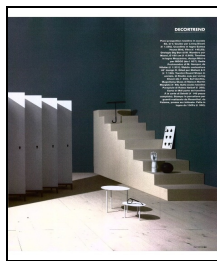
Elle Decor (I)