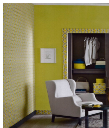
Home Hachette (I)