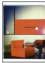
Interni Annual (I)