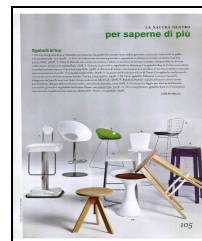
Marie Claire Maison (I)